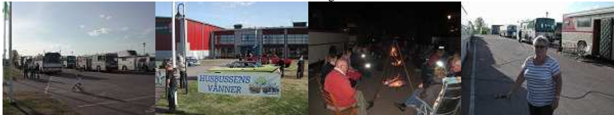
Bilder från Årsmötet i Sunne 2011