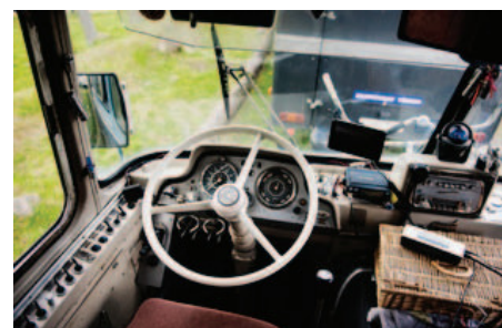
Denna Scania-Vabis från 1966 har luftfjädrar.